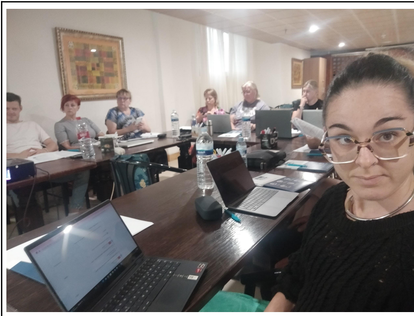
La nostra classe