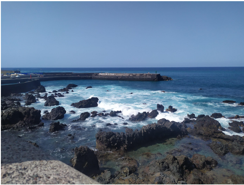
Porto del Muelle.