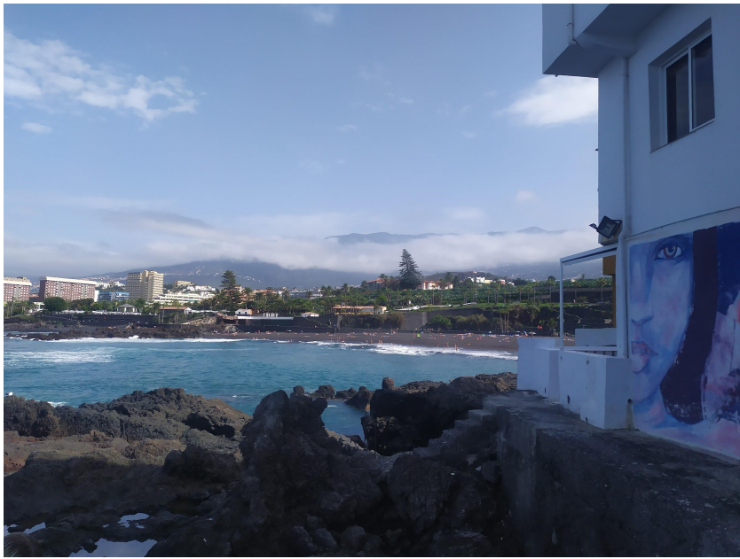
Playa Maria Jimenez vista da Punta Brava