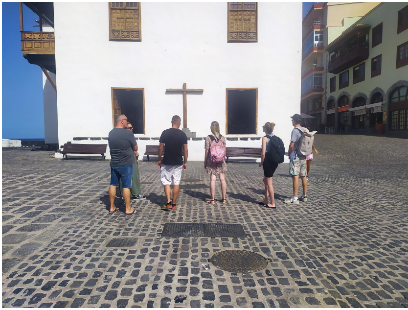
Casa de la Aduana