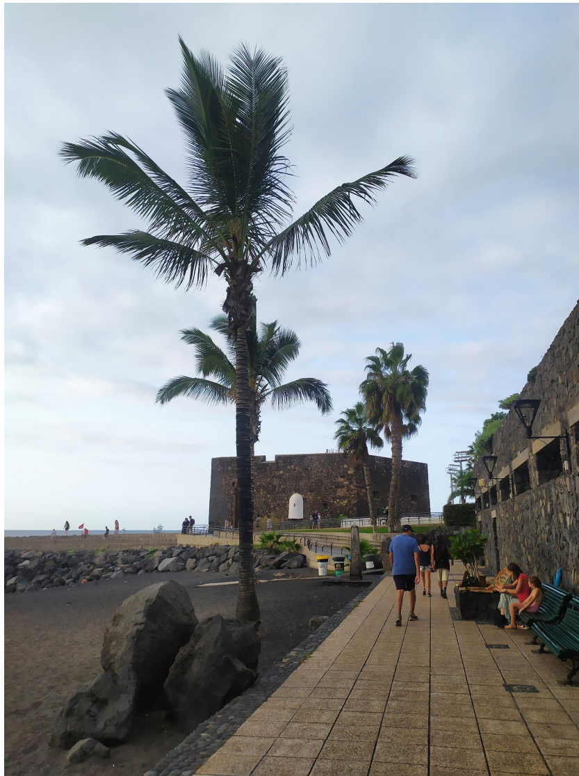
Il Castillo di Playa Castillo