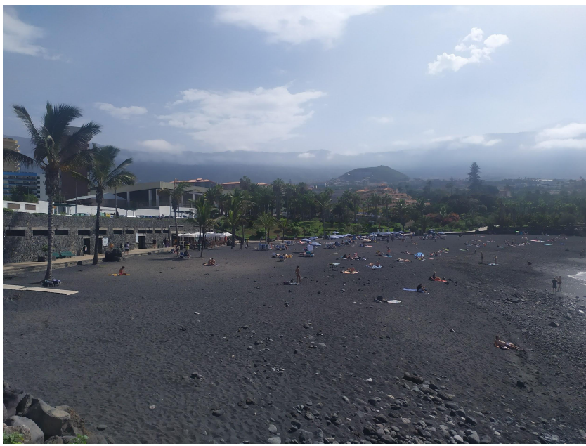
Playa Jardín (Playa Castillo)