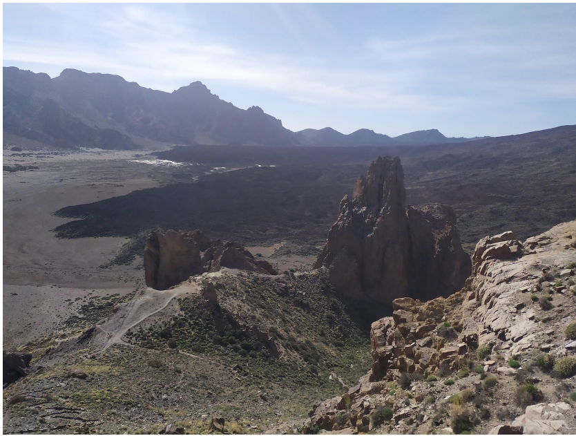
La valle ai piedi del vulcano (2000 mt c.ca sul livello del mare)