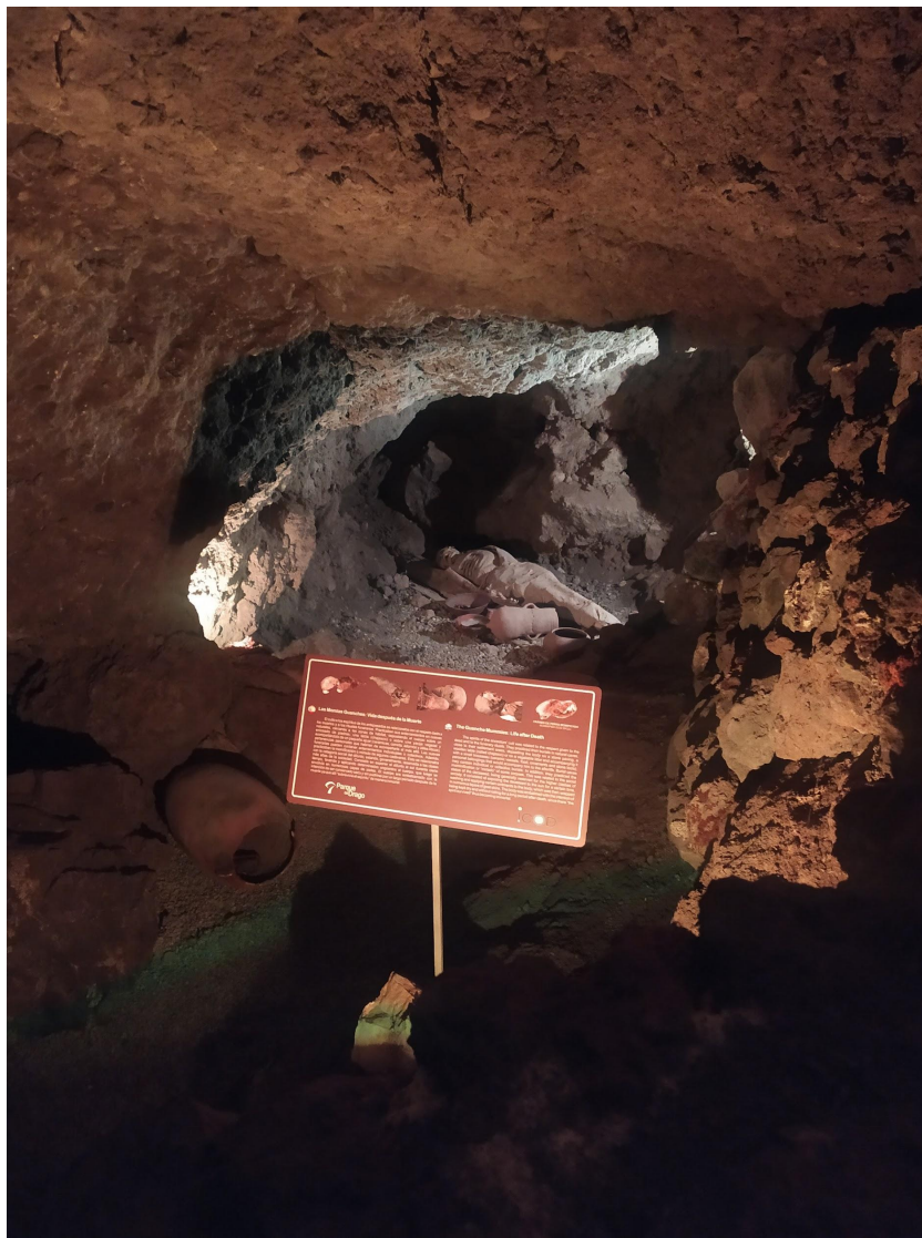
La ricostruzione di un'antica tomba Guanche, all'interno del parco del Drago.